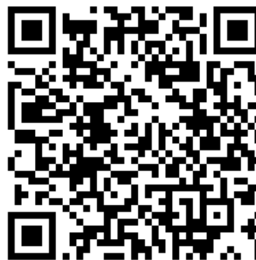
Сайт Минздрава России

Учитывая важность унификации первой помощи и использования для обучения современных учебно-методических материалов, письмом Министра здравоохранения Российской Федерации высшим исполнительным органам государственной власти субъектов Российской Федерации от 19 октября 2022 г. № 16-1/И/2-17651 было рекомендовано использовать разработанный УМК для обучения первой помощи.