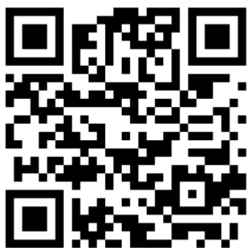
Сайт «Все о первой помощи»

сайте Минздрава России по ссылке https://minzdrav.gov.ru/documents/7188-algoritmy-pervoy-pomosch , доступ к которым возможен с основной страницы сайта через вкладку «Первая помощь».